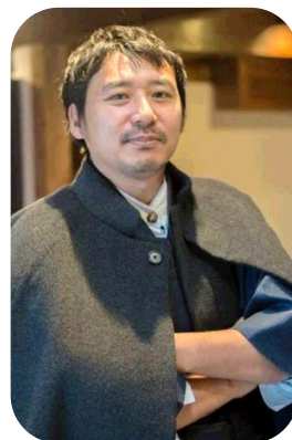
【北海道大空高等学校 HP より】

会場参加できない場合、 YouTube 配信の視聴参加（500 円）の申込み をお願いします。