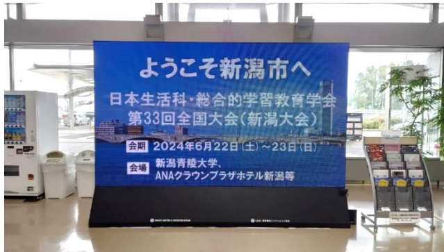
新潟空港の到着ロビーの大型モニター