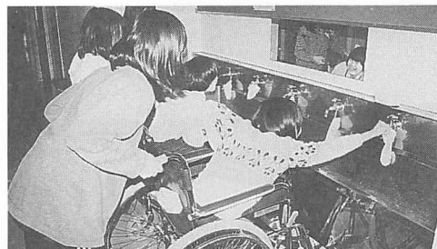
車椅子で水飲み場を使えるかな？