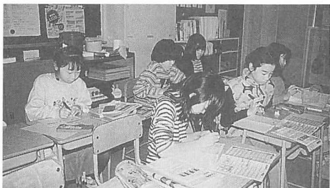
点字ペンでお手紙を書く