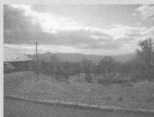
魅力いっぱい倶知安町

身近な地域を大好きになってほしい、見つめ直してほしい、また身近な人々の考えを知ること、自分の考えをしっかりと持ってほしい。そのような願いから生まれた実践です。