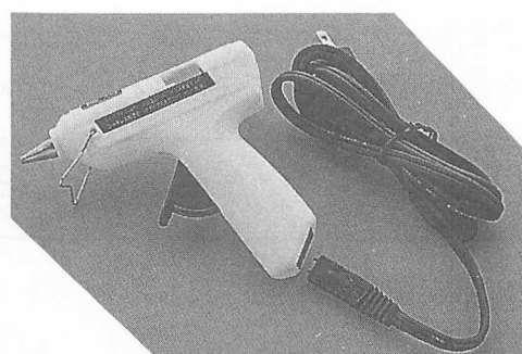
〈コードレスで使えるグルーガン〉