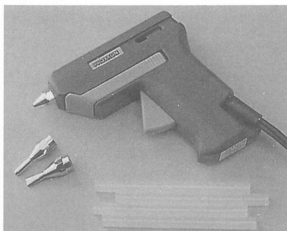
〈口の先が変えられるグルーガン〉